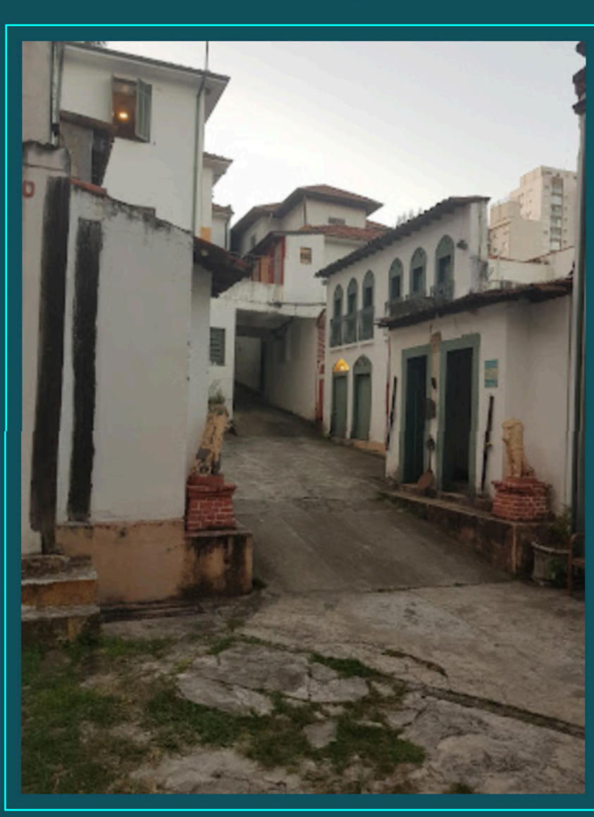
Vila Secreta fica na Rua Rubi, 50 na Aclimação.