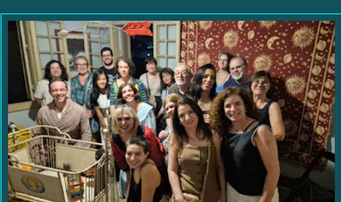
Os privilegiados de 25/04/2026

A peça encerrou uma temporada mais que relâmpago no sábado, dia 25 de abril, mas a boa notícia é que já há algumas sessões agendadas: